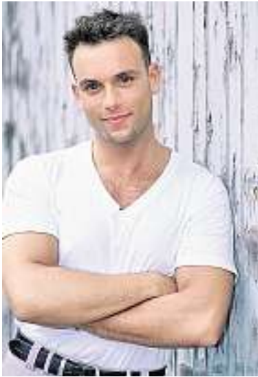
Adel Abdel-Latif, Ex-Mister-Schweiz (Ägypten)