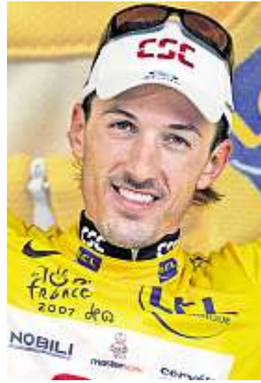
Fabian Cancellara, Radrennfahrer (Italien)