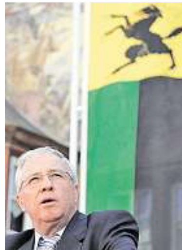
Christoph Blocher, Bundesrat (Deutschland)