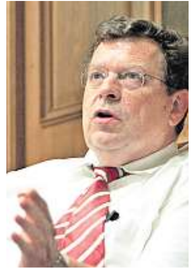
Toni Bortoluzzi, Nationalrat (Italien)