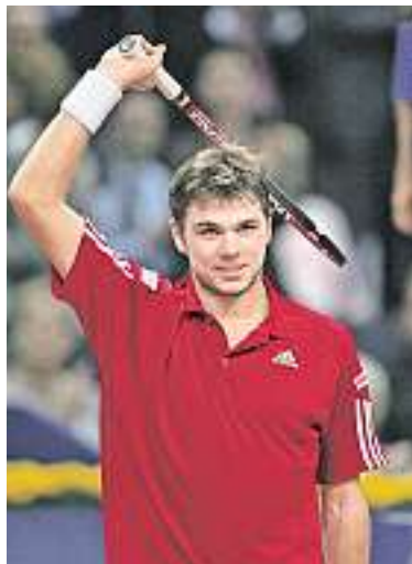
Stanislas Wawrinka, Tennisspieler (Polen)